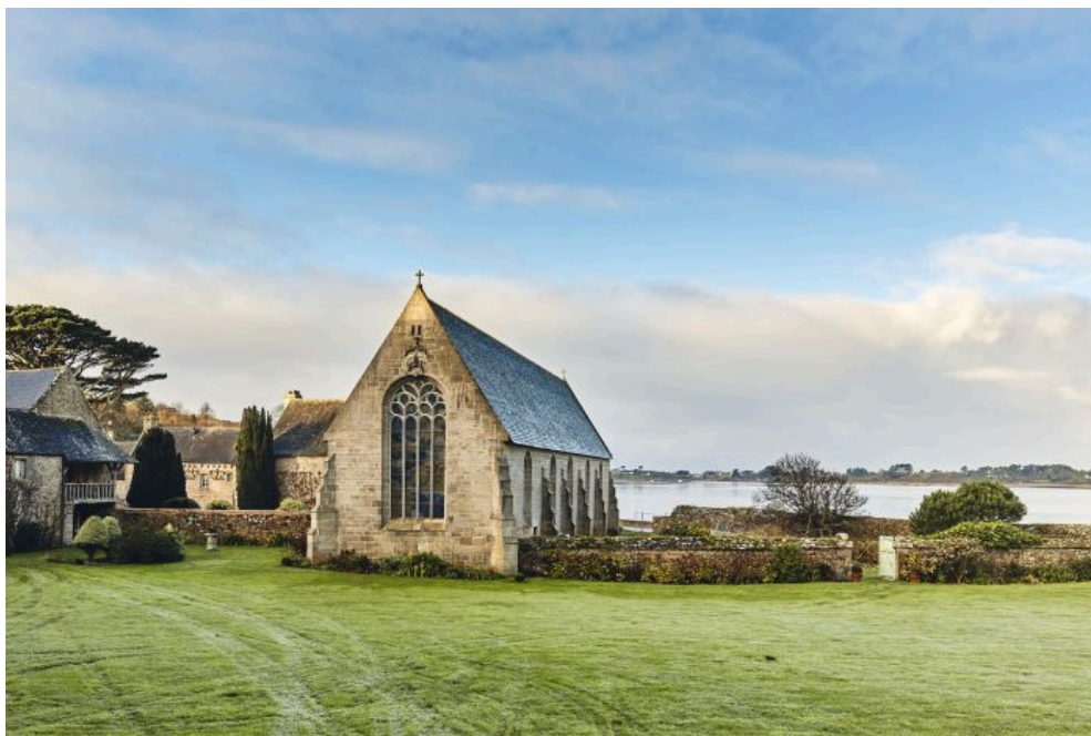
L'Abbaye Notre Dame des Anges à Landéda