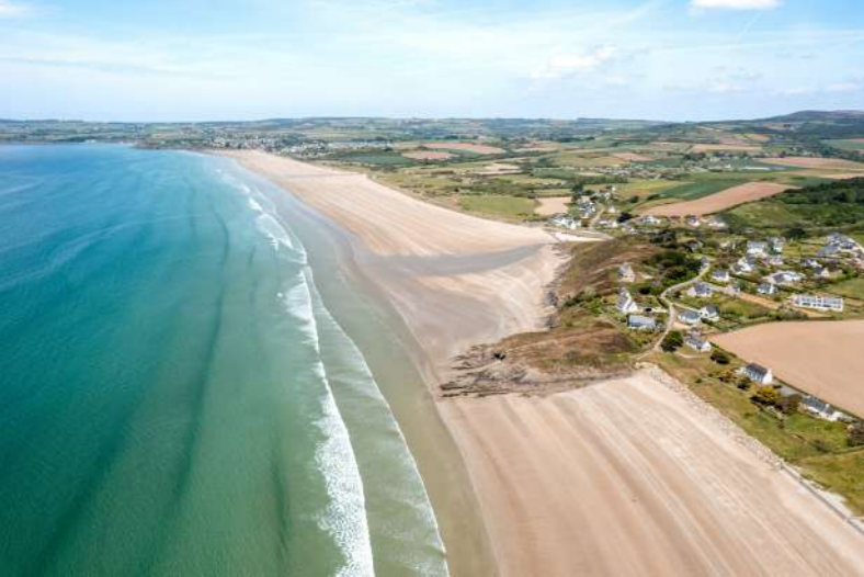
Les plages du Menez-Hom-Atlantique