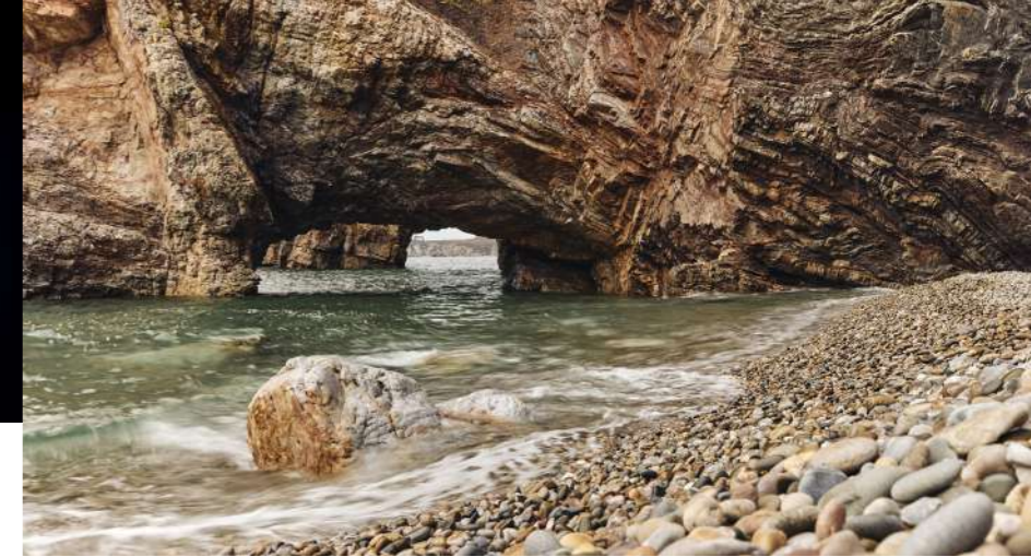
Géologie en presqu'île de Crozon