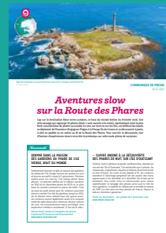
Communiqués de presse de la destination