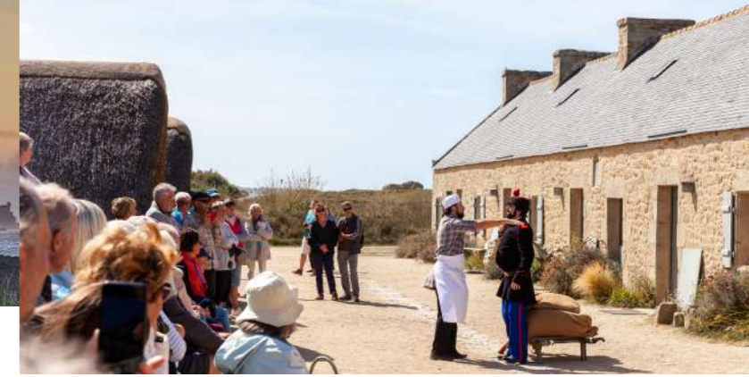
Spectacle découverte de Meneham