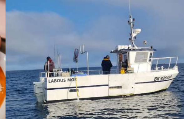
Du bateau au restaurant, une histoire de famille