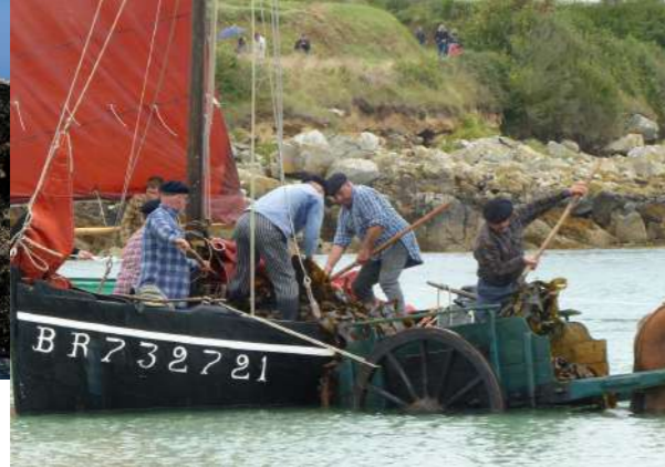
Fête des goémoniers