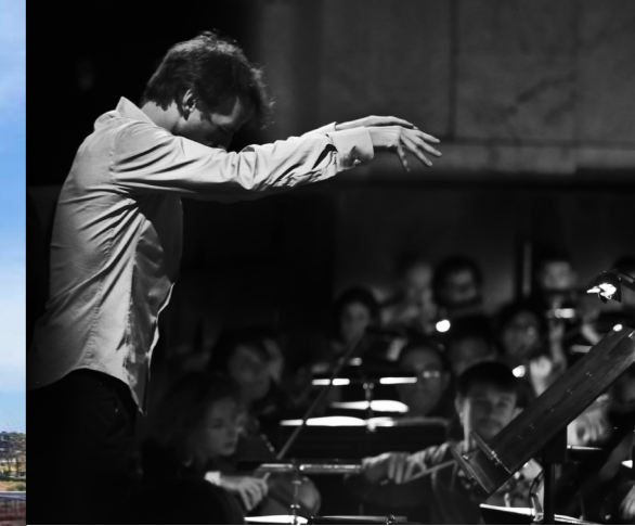
Les Ateliers des Capucins - Les Quatre saisons