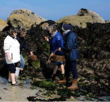
A la découverte des algues