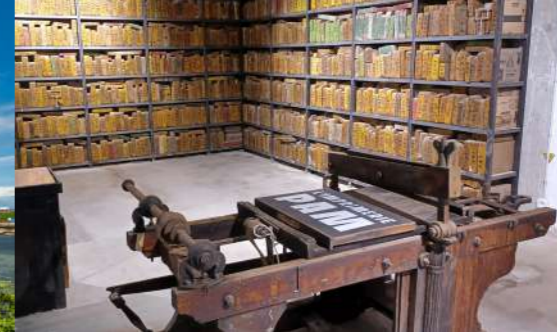
Tiers-lieu La Pam et ses archives lithographiques