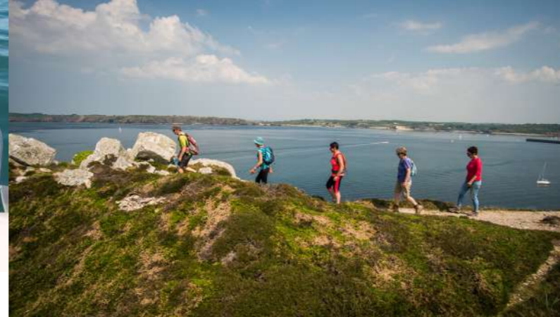
Balade nature guidée en Presqu'île de Crozon