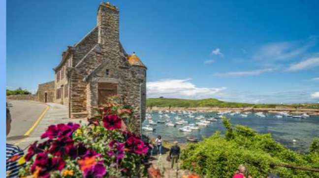
Le Conquet, face à la mer d'Iroise