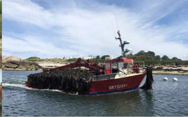
Port de Lanildut