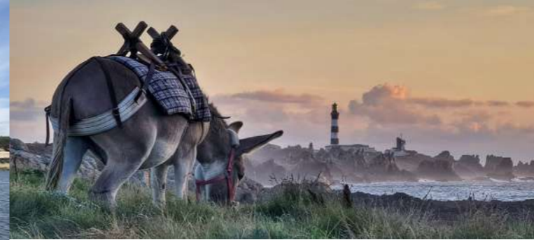
Balade insolite à Ouessant