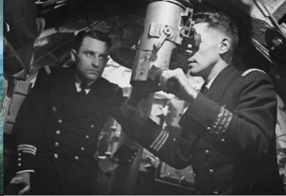
Les sous-marins à l'honneur au Musée national de la Marine