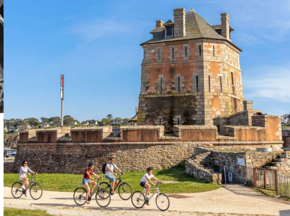
La Tour Vauban, classée au Patrimoine Mondial de l'Unesco