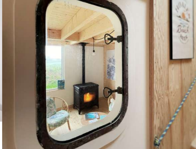
Eco-Gîte Norzh, un refuge de mer écoresponsable