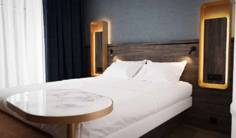
Hôtel Le Conti ouvrira ses portes en mai à Brest