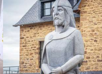
Breizh Odysée