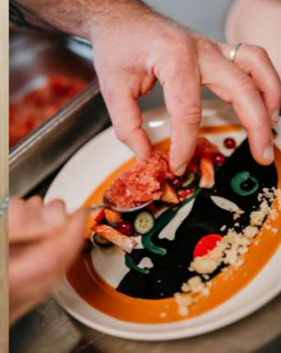
Le Jardin des Saveurs