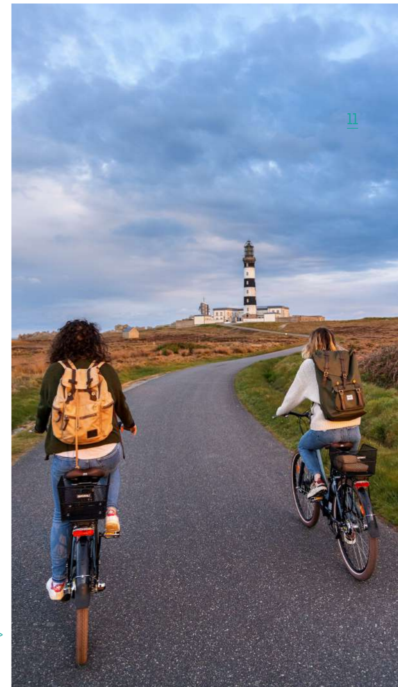
Le phare du Créac'h à Ouessant

www.visit-ouest.com/circuit/la-route-des-phares