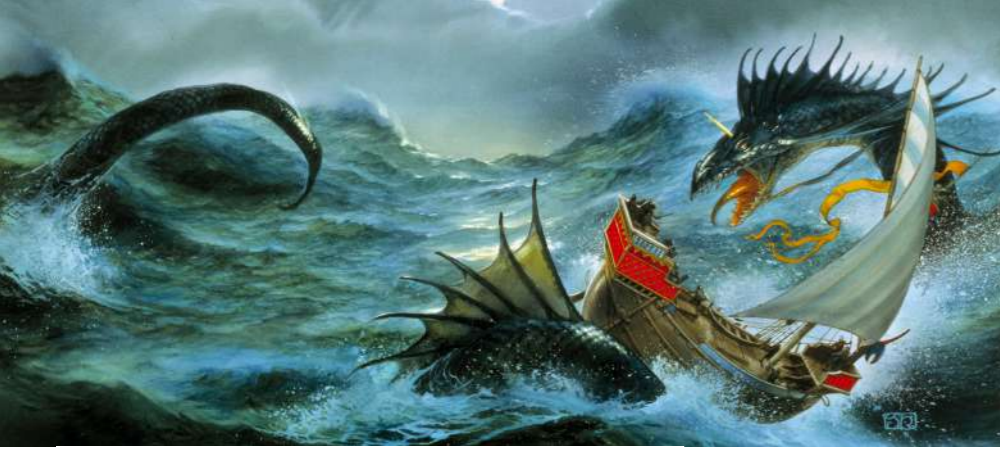
Sur les traces de Tolkien au FHEL - The wandering fire © John Howe