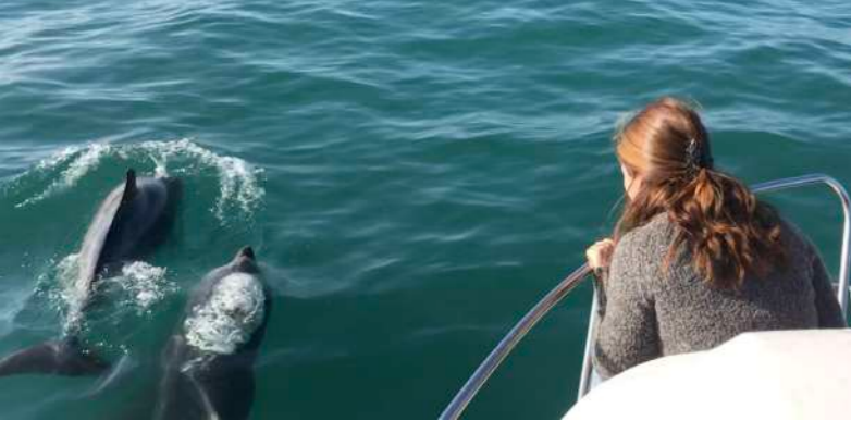
Balade dans le Parc Naturel Marin d'Iroise