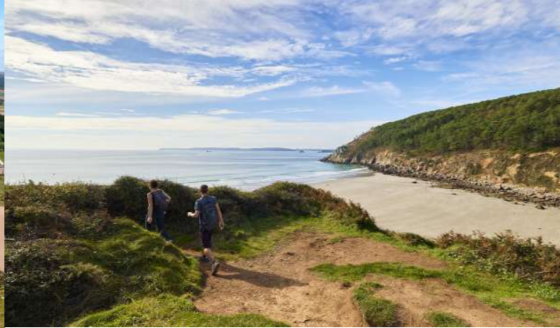
GR®34 en Presqu'île de Crozon