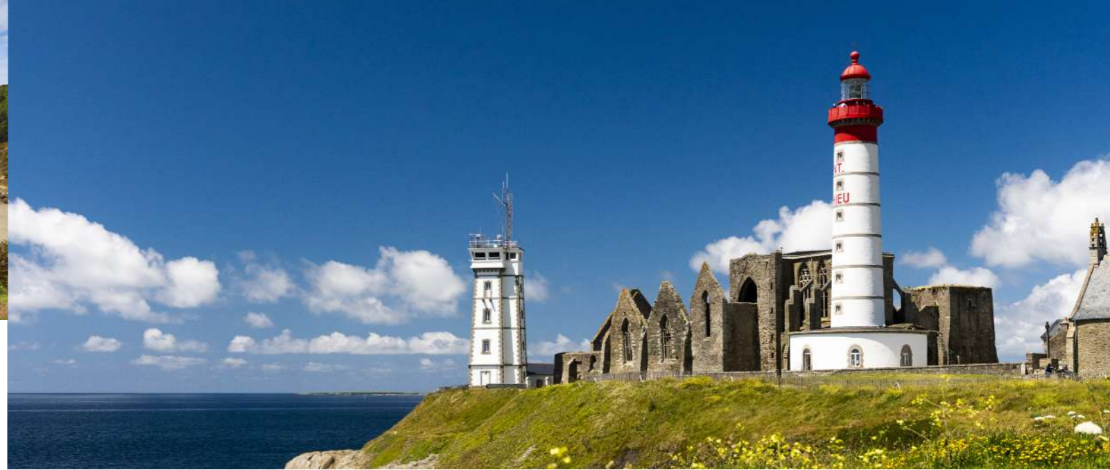
Phare de St-Mathieu © Martin Viezzer