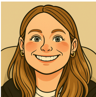
Léa CORNIC COMMUNICATION PRINT & WEB