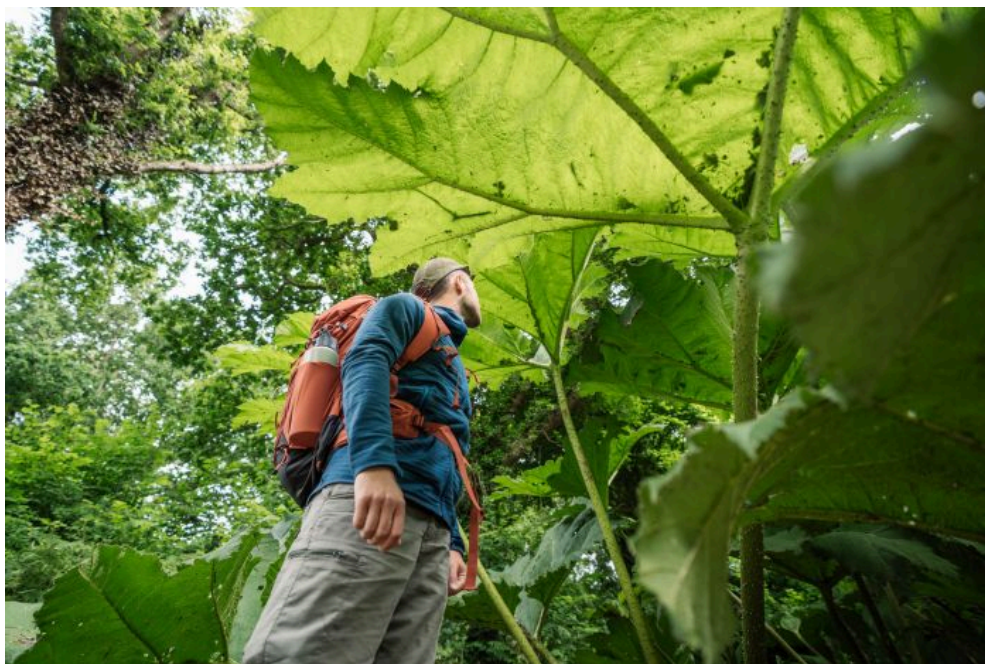
Bois du clown à Plouguerneau

🌿 Plus haut, plus loin, ensemble ! Comme ce randonneur qui se fraye un chemin sous les feuilles géantes du bois du Clown, on continue d'avancer ensemble pour faire grandir les Abers ! Novembre, c'est le mois du renouvellement du partenariat — l'occasion parfaite de repartir du bon pied, d'explorer de nouvelles idées et de préparer une belle saison 2026, main dans la main.