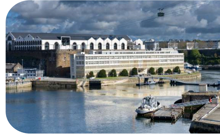
Les Ateliers des Capucins à Brest

Ci-dessus : Loch Monna en Rade de Brest Ci-contre : Rade de Brest