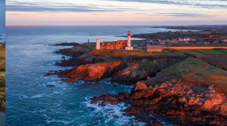
Phare de la pointe Saint-Mathieu à Plougonvelin