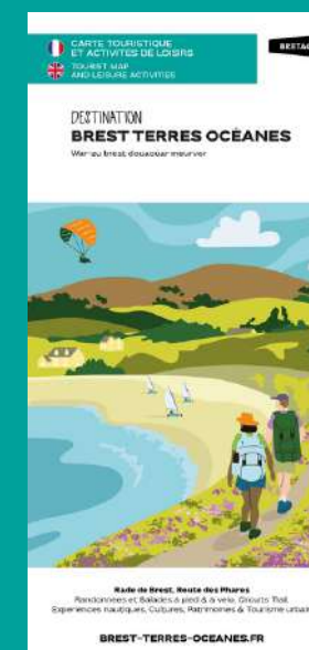
Carte touristique & activités de loisirs de la destination

Les supports de communication à votre disposition