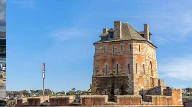
La Tour Vauban à Camaret sur mer