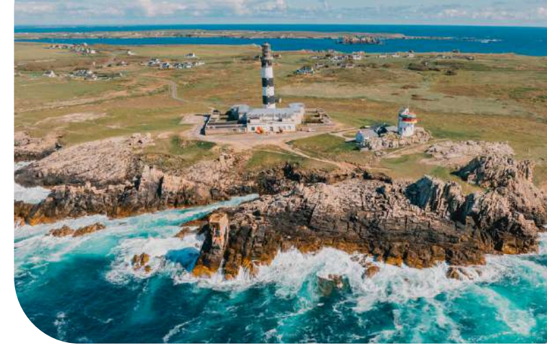
Île d'Ouessant

Côte des Légendes Pays des Abers Iroise Bretagne Île d'Ouessant Brest en vue Pays de Landerneau Daoulas Presqu'île de Crozon - Aulne maritime Menez-Hom Atlantique