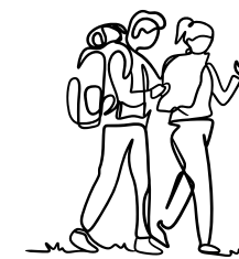
Ci-dessus : Pointe de Kermorvan au Conquet