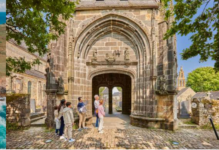
Daoulas ©Alexandre Lamoureux