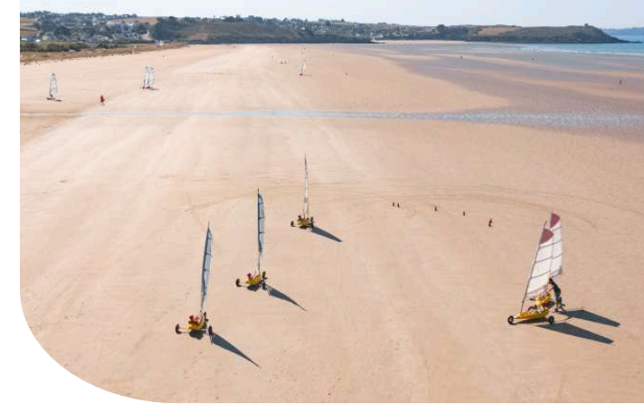
Char à voile sur la plage de Pentrez