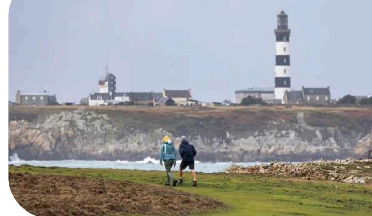
Rando sur l'île d'Ouessant

Le GR® de Pays d'Iroise, quant à lui, avec ses 107 km en 6 jours, invite à découvrir les trésors discrets d'un littoral empreint de sérénité et de traditions maritimes.