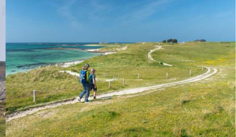
Randonnée le long du GR®34 à Landéda