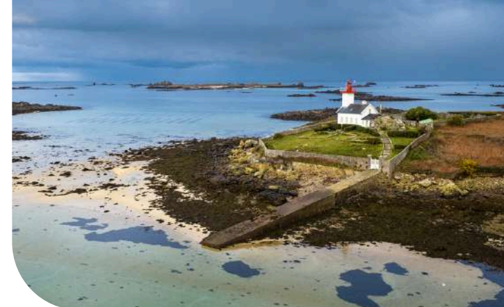
Phare de l'île Wrac'h à Plouguerneau

Avec ses 5 phares, Ouessant mérite bien en effet son surnom de l'île aux phares. Le Créac'h, facilement reconnaissable avec ses bandes noires et blanches est l'un des phares le plus puissants d'Europe et marque la ligne de départ officielle pour les grands records à la voile.