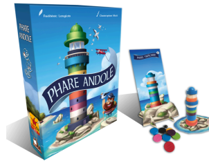
Jeu Phare Andole

Ce jeu de 54 cartes présente les plus beaux phares de France, photographiés le plus