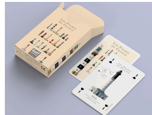
Jeu de cartes Phares

La boutique de l'Office de Tourisme s'enrichit avec de nouveaux jeux pour enfants autour des phares et de la mer. De quoi ravir les jeunes explorateurs en herbe et prolonger l'esprit des vacances à la maison ! En vente dans nos bureaux ou en ligne.