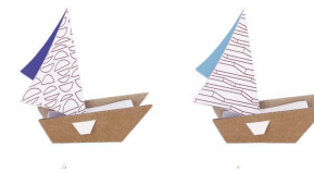
Kit créatif de petits voiliers

Retrouvez vos manches et lancez-vous dans la construction de phares plus