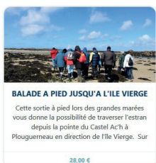
BALADE A PIED JUSQU'A L'ILE VIERGE

Attention : Le billet ne comprend pas le transport. Il est impératif de réserver un transport avant l'achat de votre billet de visite. Réservez dès maintenant votre billet pour la