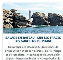
BALADE EN BATEAU : SUR LES TRACES DES GARDIENS DE PHARE

Embarquez à la découverte des secrets de l'Aber Wrach et de son archipel, de l'île Vierge et de son phare. Accompagné de votre guide skipper, l'excursion inclut la visite privative du