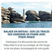
BALADE EN BATEAU : SUR LES TRACES DES GARDIENS DE PHARE AVEC PIQUE-NIQUE

Embarquez à la découverte des secrets de l'Aber Wrach et de son archipel, de l'île Vierge et de son phare. Accompagné de votre guide skipper, l'excursion inclut la visite privative du