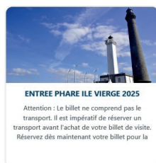
ENTREE PHARE ILE VIERGE 2025

Attention : Le billet ne comprend pas le transport. Il est impératif de réserver un transport avant l'achat de votre billet de visite. Réservez dès maintenant votre billet pour la