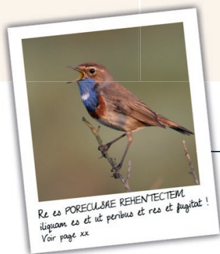
Exemple d'une photo légendée