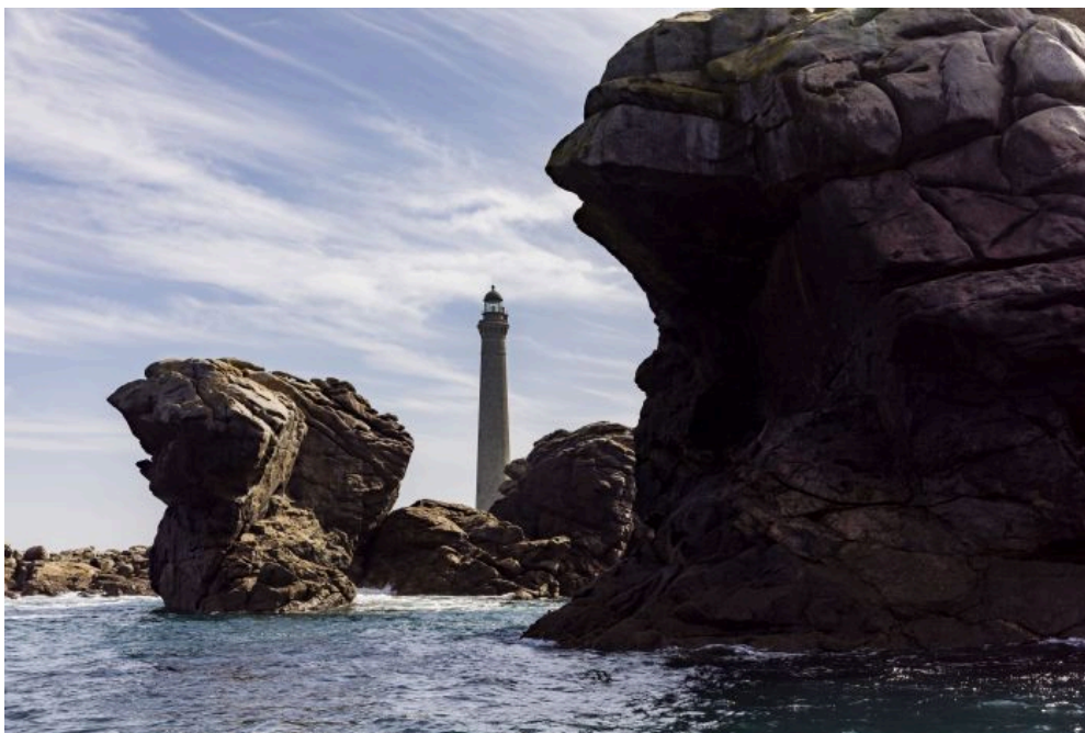
Le grand phare de l'Île Vierge

La météo durant les vacances de la Toussaint a été plutôt très agréable ce qui a permis aux visiteurs de proximité de (re)découvrir avec plaisir le Pays des Abers.